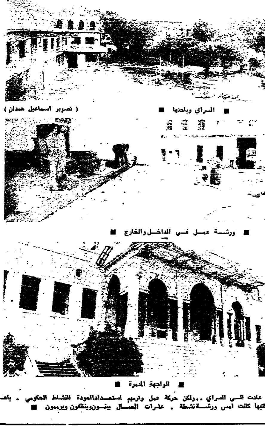
السراي ومكتبتها كانت امس ورشة نشطة . عشرات العمال يسوّون وينظفون ويرمون .